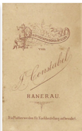
Photo im carte de visite Format