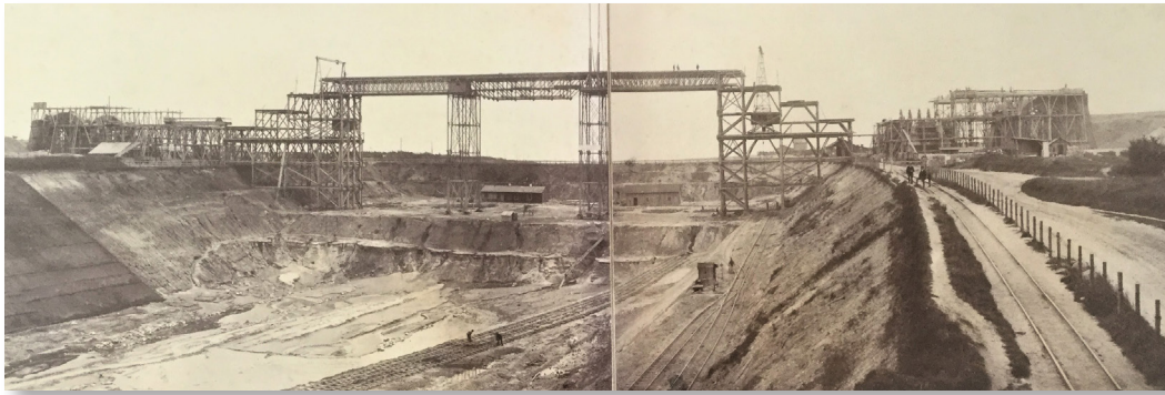
Original-Album des Photographen Gotthilf Constabel Mit 16 Großfotos vom Kanalbau